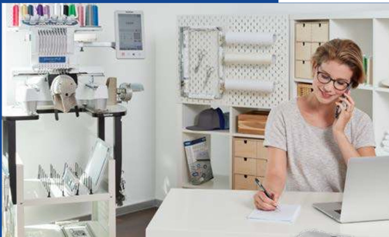
Table pour la broderie tubulaire*, pour gérer les grands ouvrages