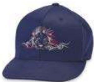
SYSTÈME CASQUETTE RÉGULIER

Brodez une grande variété de types de casquettes avec le cadre pour casquette facile à utiliser. Vous pouvez broder 35 % plus près du bord (6-10 mm), une spécificité idéale en fonction de la casquette.