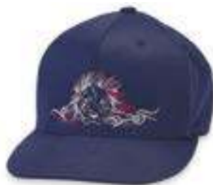
SYSTÈME CASQUETTE À BORD PLAT