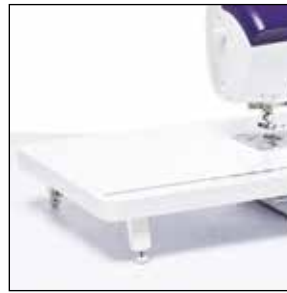
Table d'extension extra-large

Agrandissez votre plan de travail avec cette table d'extension extra-large. Idéale pour les ouvrages de quilting et de couture de grande taille. La table dispose d'une règle et d'un espace de rangement pour votre genouillère.