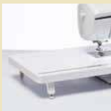
Table d'extension extra-large

Libérez vos mains en utilisant la genouillère pour relever/abaisser le pied de biche. Idéale pour travailler sur de grands ouvrages tels que les quilts.