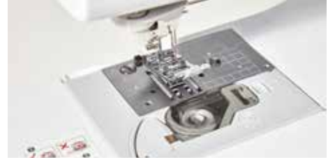
Entraînement à 7 griffes