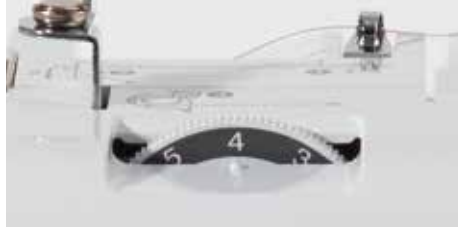
Réglage de la tension du fil