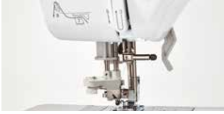
Système d'enfilage de l'aiguille avancé