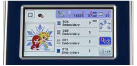
Écran tactile couleur LCD 9,4 cm