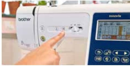
Commandes à portée de main