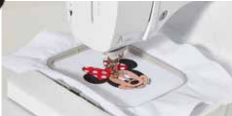
Champ de broderie de 100 x 100 mm