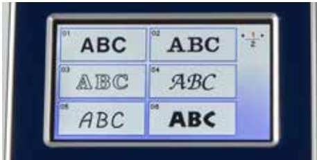
Styles de polices de caractères intégrés