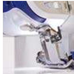
Eclairage par LED du plan de travail