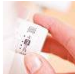
Réglage de la largeur de point