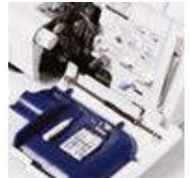
Rangement astucieux des accessoires