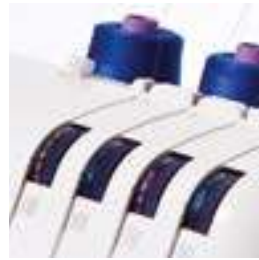
Guide d'enfilage avec repères en 4 couleurs