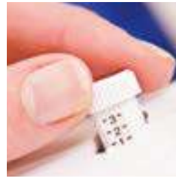
Contrôle de la pression du pied presseur