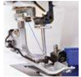
Système d'enfilage automatique du fil