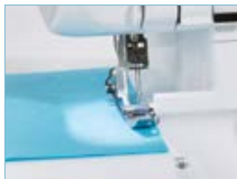
Eclairage par LED du plan de travail