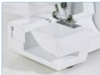
Bras libre et plan de travail extra-plat