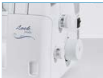
Accès simplifié aux réglages