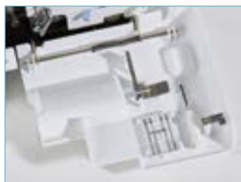
Rangement astucieux des accessoires