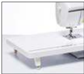
Table d'extension extra-large

Agrandissez votre plan de travail avec cette table d'extension extra-large. Idéale pour les ouvrages de quilting et de couture de grande taille. La table dispose d'une règle et d'un espace de rangement pour votre genouillère.