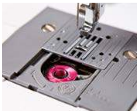
Mise en place rapide de la canette