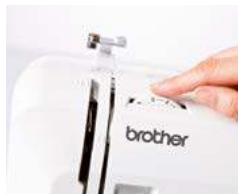
Ajustement de la tension du fil

Pour plus d'informations, contactez votre Spécialiste ou rendez-vous sur sewingcraft.brother.eu .