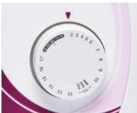
Commande simple de sélection des points