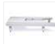
Table d'extension extra-large

Réalisez des coutures "à l'envers" (avec l'envers du tissu orienté vers le haut) en utilisant des fils décoratifs spéciaux trop gros pour le chas de l'aiguille.